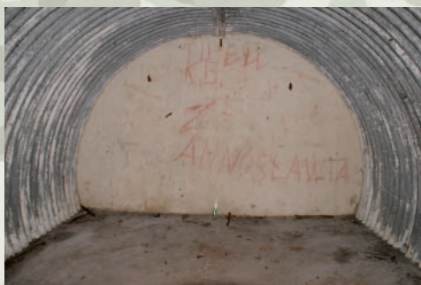
Wnętrze schronu biernego