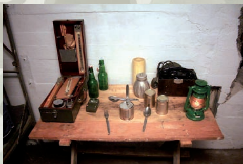
Ekspozycja we wnętrzu schronu bojowego