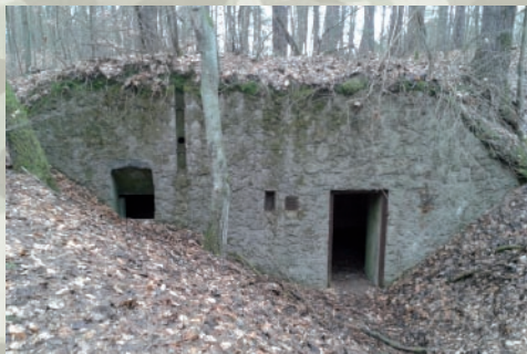
Schron bierny na zapleczu schronu bojowego

Obrońca schronu bojowego w Starych Jabłonkach wspomagana była przez drużyny wojska niemieckiego rozlokowane w pięciu schronach biernych, usytuowanych w najbliższej okolicy. Duże betonowe obiekty o ścianach i stropach o grubości 1-1,5 m, wzmocnione były wewnątrz falistą blachą. W obiektach tych znajdują się dwa pomieszczenia o konstrukcji półkolistej (przekrój 2/3 walca). Komory schronu biernego połączone były niskim, wąskim przejściem. Jedno z pomieszczeń przeznaczone było na skład prowiantu, uzbrojenia, amunicji i innych materiałów. W tej komorze znajdowało się również wyjście awaryjne. Drugie pełniło rolę izby kwaterunkowej. Wszystkie tego typu obiekty posiadały podstawowe wyposażenie socjalne: piecyki grzewcze, stoły drewniane, system wentylacji itp. Poszczególne bunkry bierne uzupełniane były siecią okopów, stanowisk ziemnych i rowów przeciwczołgowych. Często też na przedpolu wykonano zasieki oraz zapory drogowe. Do 1939 roku wybudowano 118 takich schronów biernych.