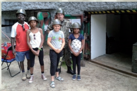
Zawitali tu nawet turyści z Togo

Na tym kończy się historia wykorzystania olsztyneckich umocnień. Przez lata po 1945 roku były niszczone i okradane z metalowych części. Palnikami wycinano 100 mm pancerne płyty – szczęśliwie taki los ominął bunkier w Starych Jabłonkach. Schron bojowy i schrony bierne należą do Lasów Państwowych, w Nadleśnictwie Stare Jabłonki. Na mocy zawartego porozumienia opiekę nad nimi sprawuje Koło nr 5 Związku Żołnierzy Wojska Polskiego z Ostródy, które od marca do czerwca 2014 roku wykonało gruntowny remont schronu bojowego. 14 czerwca 2014 roku w uroczystym otwarciu wzięło udział około 500 osób. Dzięki bijącej rekordy popularności turystyce militarnej Skansen Fortyfikacji podczas sezonu 2014 obejrzało ponad 4000 osób. We wrześniu 2014 roku w wojewódzkim Konkursie „Godni Naśladowania” Koło nr 5 Związku Żołnierzy Wojska Polskiego za realizację Skansenu Fortyfikacji Stare Jabłonki otrzymało nagrodę i tytuł laureata konkursu.