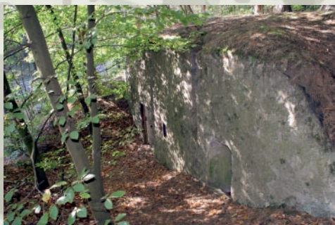
Schron bierny po drugiej stronie nasypu kolejowego