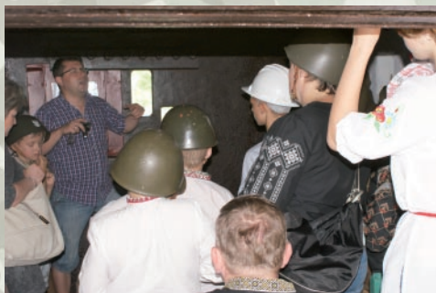
Skansen Fortyfikacji odwiedza coraz więcej turystów

Krzysztof Bieńczyk, skarbnik Koła nr 5 ZŻWP Od samego początku pomysł wspólnej pracy spotkał się z wielkim entuzjazmem nas wszystkich. Przy remoncie pracowali nasi członkowie w wieku od 17 do 80 lat.