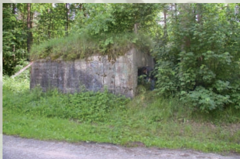
Schron bojowy - stan z 2005 roku