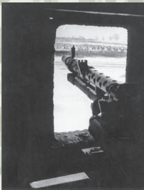
Karabin maszynowy MG34 na stanowisku

Otwarcie Skansenu Fortyfikacji w czerwcu 2014 r.