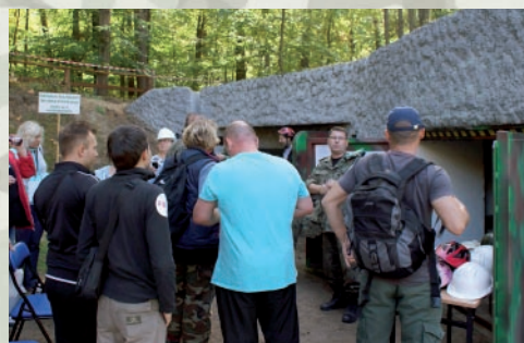
Skansen cieszy się powodzeniem także jesienią