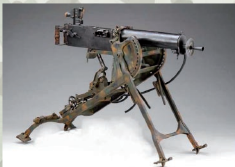
Ciężki karabin maszynowy MG08